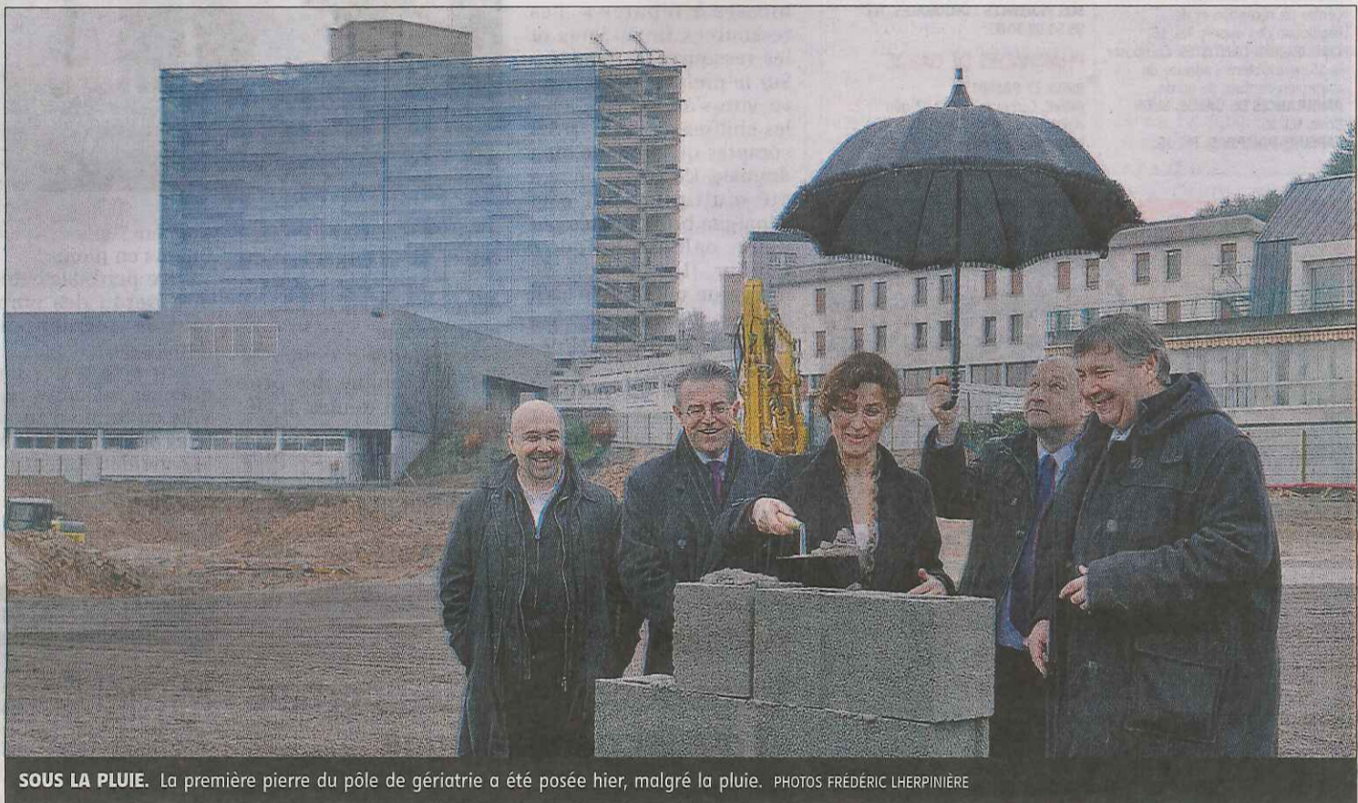
SOUS LA PLUIE. La première pierre du pôle de gériatrie a été posée hier, malgré la pluie.

cité », « un vaisseau », le pôle de gériatrie sera entièrement dédié aux personnes âgées. Il regroupera des services déjà existants au septième étage de l'hôpital comme l'accueil de jour, les consultations, l'unité d'hébergement renforcé (UHR), les soins de suite gériatrique et les courts séjours avec de nouveaux. Ces derniers sont au nombre de trois : « l'hôpital de jour, un accueil spécialisé pour les mala-